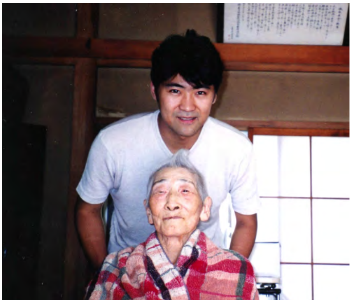
祖母の介護を手伝っていた当時

今後3〜5年、 景気回復に全力 を挙げたのち、将来的には、税制抜本改正の中で対応しなければなりません。それまでの間、 税金の無駄遣い撲滅PT の事務局次長として、引き続き、役所・公益法人・独立行政法人の無駄遣いを一つずつ、真面目に是正するほか、世襲問題や天下り問題に切り込んでいきます。